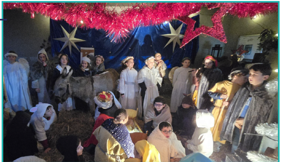
Group scolaire Saint-Vincent - Brest Une crèche vivante réalisée avec les élèves volontaires. On y trouve aussi quelques animaux. C'est un moment de paix, de partage, de joie où tout le monde est heureux.