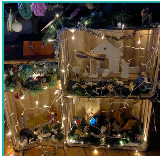
École Notre Dame de Kerbertrand - Quimperlé