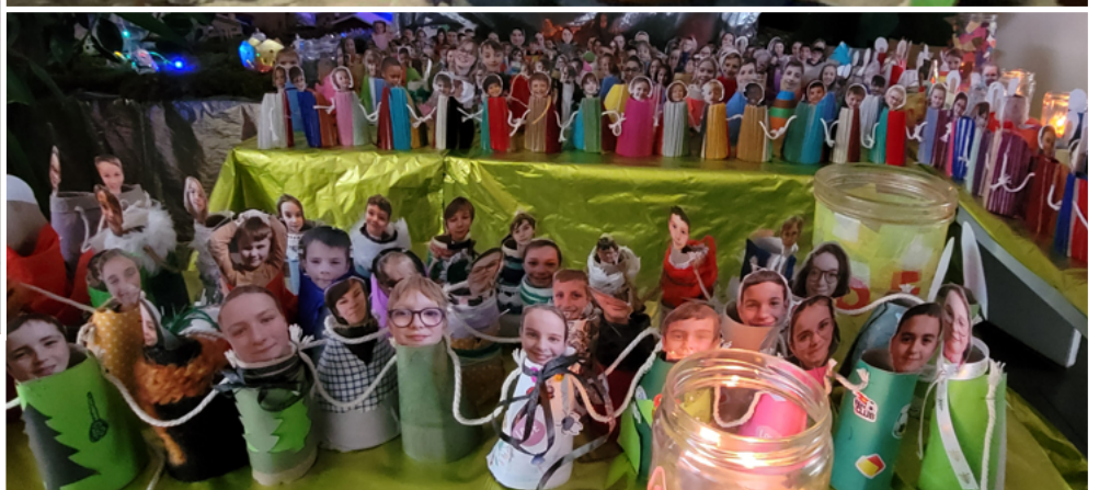
École Saint-Charles/Saint-Raphaël - Quimper L'esprit de Noël, des échanges, des rencontres où le partage et la solidarité ont été mis au premier plan.